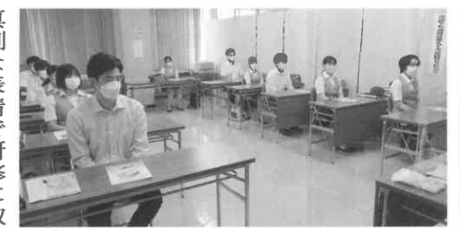
真剣な表情で研修に取り組んでいました。

入組から4ヵ月を過ぎ、より一層のレベルアップを図るため、8月22日～24日までの3日間のスケジュールで、預金全般、為替、自動振替などの事務等に関する指導を受けました。