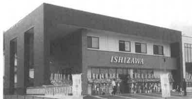
同社が経営しているおくりもの専門店「イシザワ佐用店」は、お中元やお歳暮、冠婚葬祭時のお祝い・お返しギフトや母の日ギフト、新作ワインなど数多くの商品を取り揃えており、特に若年層向けの雑貨詰合せギフトは大人気です。

◆「イシザワ佐用店」新築移転オープン 当支店取引先の(株)イシザワがこの度、新社屋を新築し、移転しました。写真。